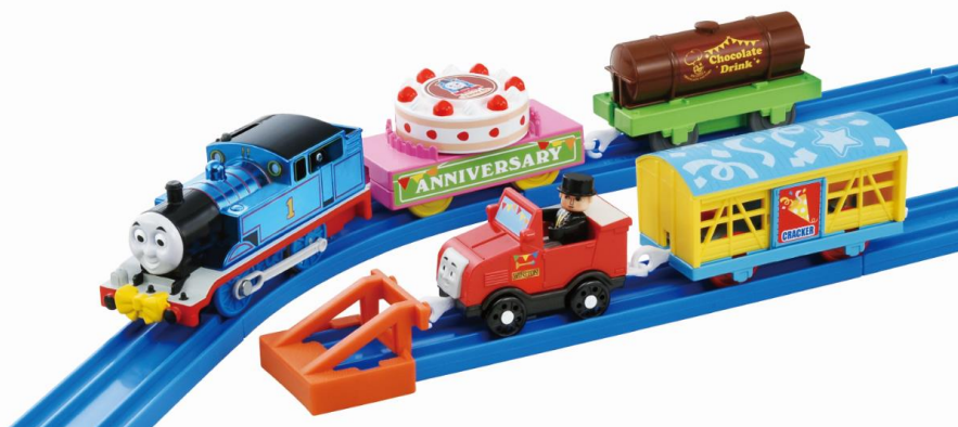
「プラレールトーマス25周年 青いピカピカトーマスのパーティーセット」

シリーズ発売25周年を迎えた今年、テーマソング「レッツゴー！プラレールきかんしゃトーマス！」(※2)が発表されたり、3月に発売された「プラレール 蒸気がシュッシュッ！トーマスセット」(希望小売価格:5,800円/税抜き)が「日本おもちゃ大賞2017」において「イノベティブ・トイ部門」大賞を受賞するなど、大きな注目を集めています。