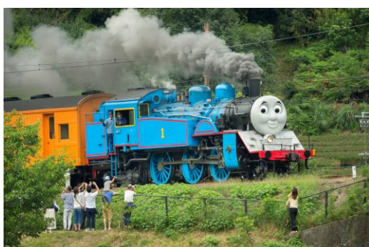
大井川鐵道「きかんしゃトーマス号」